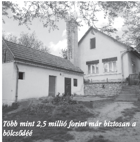
Több mint 2,5 millió forint már biztosan a bölcsődéé

A Szokolya SK - az önkormányzat segítségével benyújtott - TAO pályázatára az MLSZ 22,5 millió forint külső forrásból igénybe vehető támogatási keretet hagyt jóvá. A határozat értelmében több, mint 3 millió forint jut utánpótlás-nevelésre, közel 800 ezer forintból a pálya karbantartását szolgáló eszközöket vásárolhat az egyesület. A beadott tervek alapján első körben 17,7 millió forint fordítható a sportöltöző külső és belső felújítására. Jelenleg is dolgozunk a megítélt összeg lefedése kapcsán. Kérjük azon Vállalkozásokat, akik szeretnék a helyi Sportkör segítségére lenni jelezzék, örömmel fogadunk minden segítséget. A TAO pályázat kapcsán köszönöm Lucza Gergely alpolgármester, Szabó Gábor a Településfejlesztési Bizottság tagja és Jánosi János főépítész segítségét.