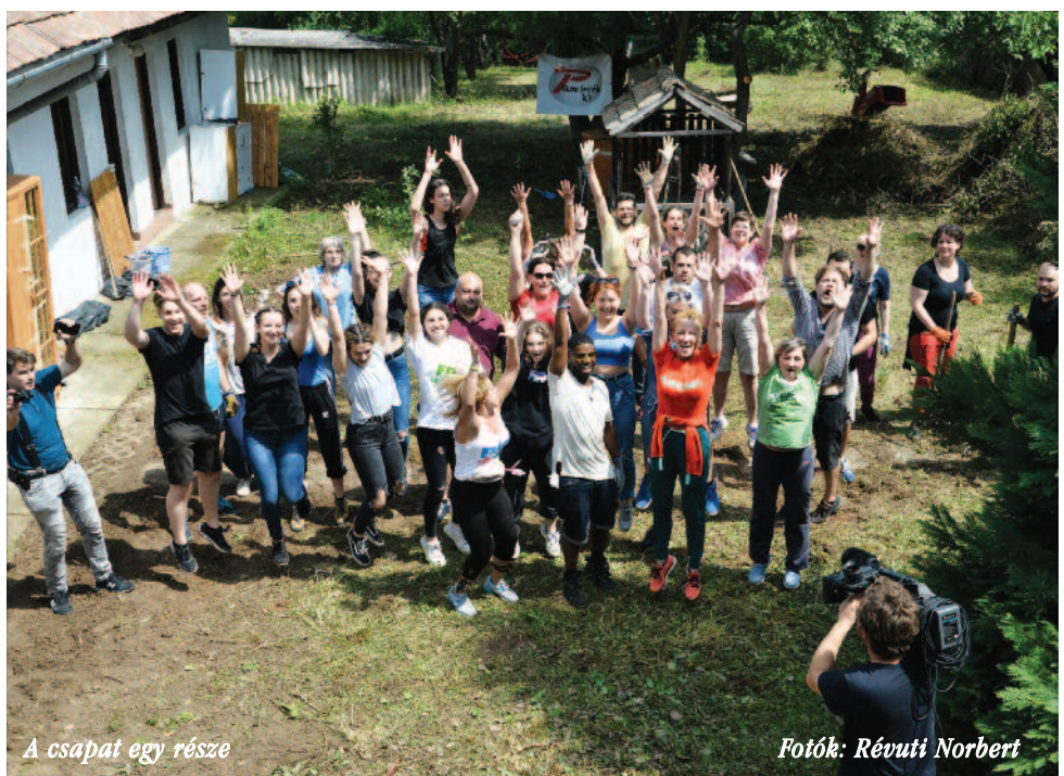
A csapat egy része