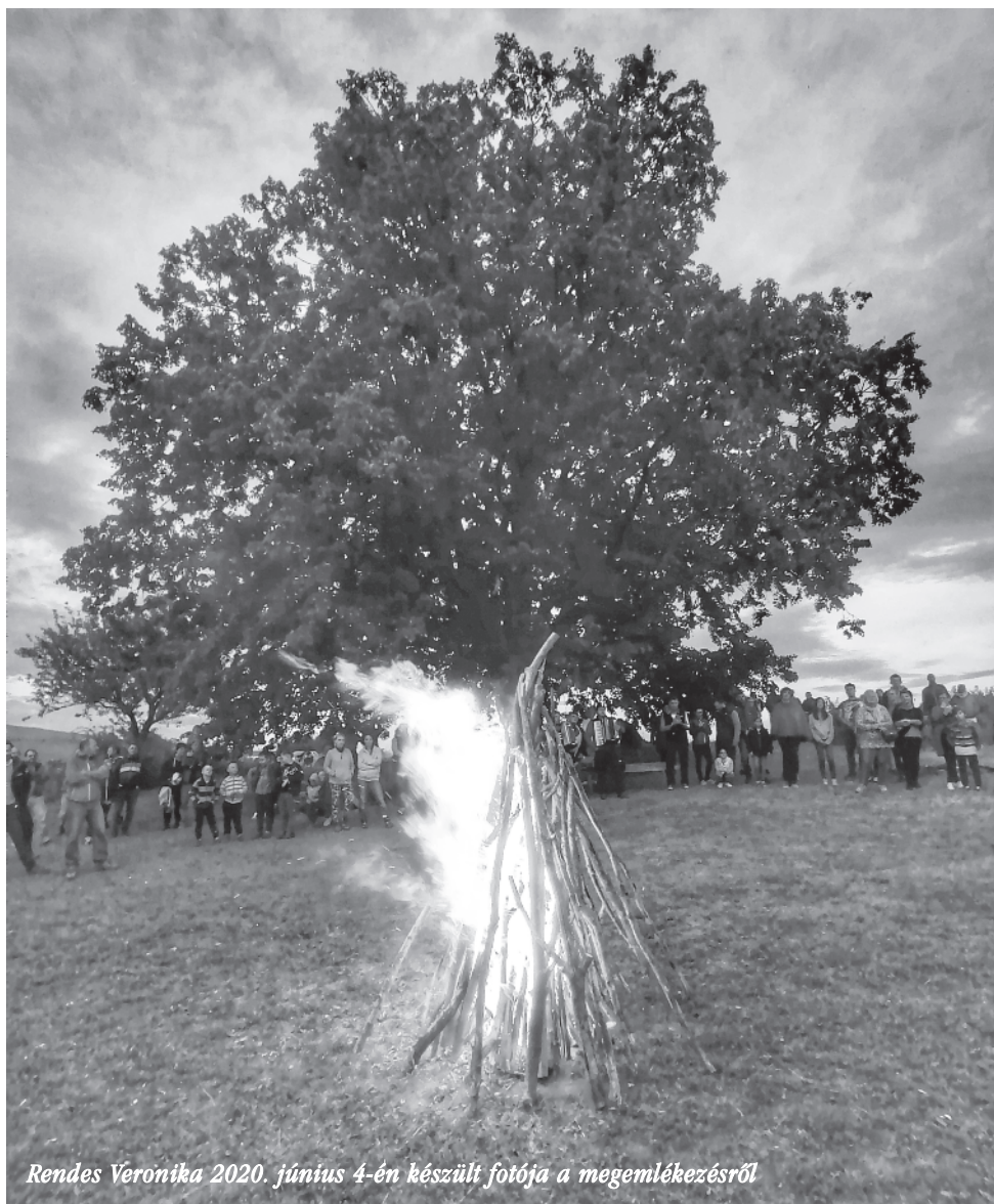
Rendes Veronika 2020. június 4-én készült fotója a megemlékezésről