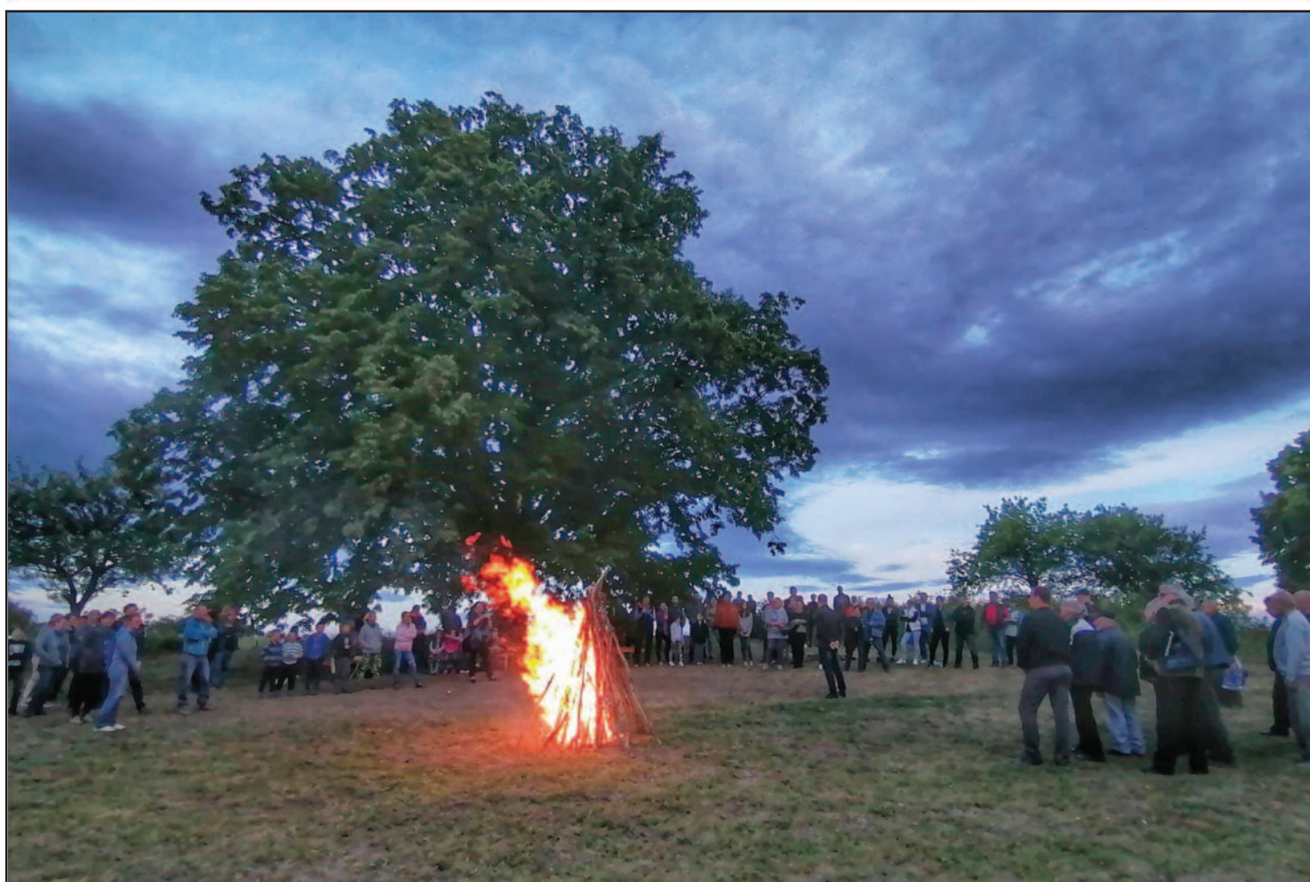
A trianoni diktátum tragédiájának 100. évfordulóján a hársfánál, őrizve a tüzet

SZOKOLYA POLGÁRAINAK LAPJA Ingyenes példány XXIV. évf. 3. szám - 2020.