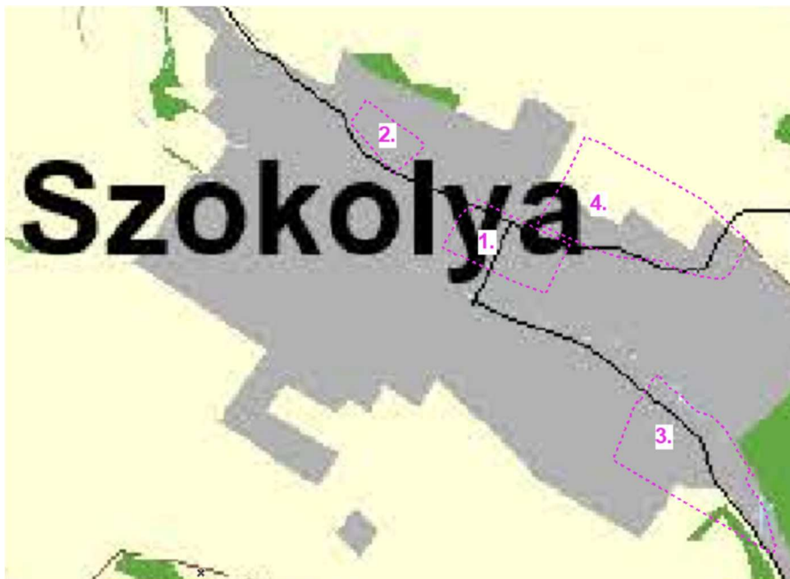
PMTTrT Szerkezeti Tervének a tervezési területre (rózsaszín kontúr) vonatkozó részlete

Szokolya község településrendezési eszközeinek módosítása során a Magyarország és egyes kiemelt térségeinek területrendezési tervéről szóló 2018. évi CXXXIX. törvény, valamint a területrendezési tervek készítésének és alkalmazásának kiegészítő szabályozásáról szóló 9/2019. (VI. 14.) MvM rendeletet kell érvényesíteni.